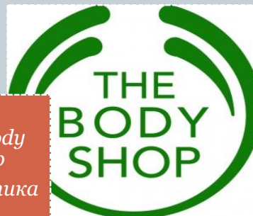
The Body Shop Косметика