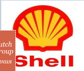
Royal Dutch / Shell Group НГкомпания