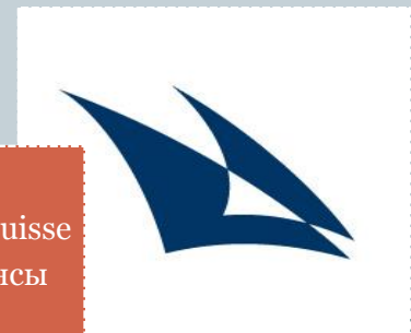
Credit Suisse Финансы